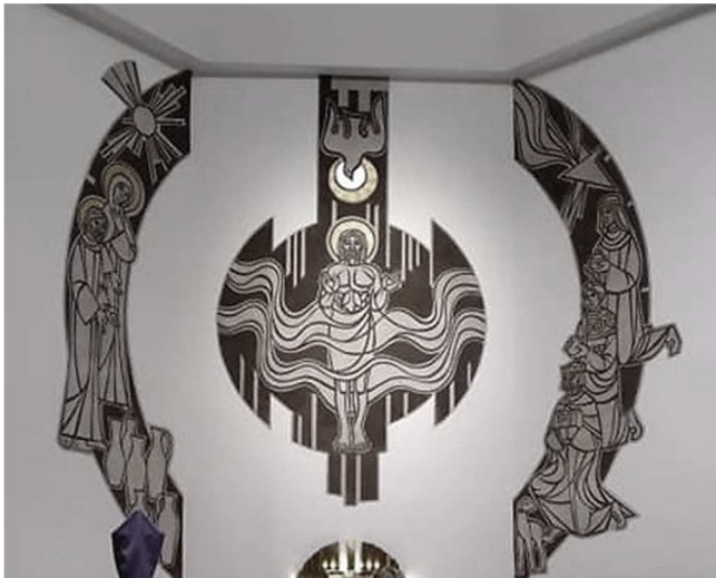
Parafia Objawienia Pańskiego w Poznaniu

Tego dnia w Kościele wspominamy aż trzy wydarzenia: